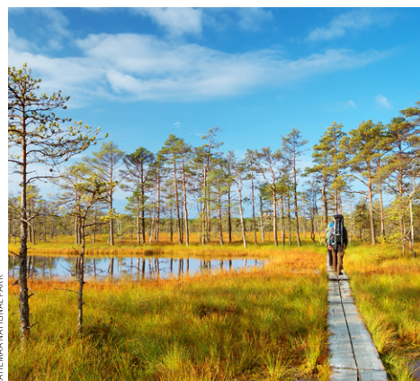
LAHEMAA NATIONAL PARK

Erleben Sie heute die lettische Landeshauptstadt Riga an der Mündung der Düna. Während einer Stadtrundfahrt mit deutschsprachigem Guide werden Sie u.a. das Jugendstilviertel sowie die Altstadt entdecken. Tipp: vom Turm der Petrikirche hat man einen wunderschönen Blick über die Altstadt. Ebenfalls sehenswert sind das Schwedentor, die alte Stadtmauer sowie das Freiheitsdenkmal. Nach der Stadtrundführung besteht die Möglichkeit, ein traditionell