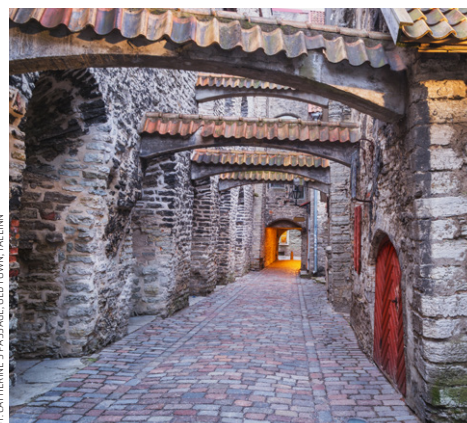
ST. CATHERINES PASSAGE OLD TOWN TALLINN

lettisches Mittagessen einzunehmen (optional zubehbar). Rückfahrt nach Jurmala. Übernachtung im Hotel Jurmala Spa .